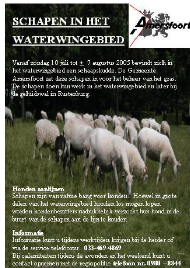
Foto1: De gemeente Amersfoort (NL) plaatst informatieborden als schapen (tijdelijk) een gebied begrazen.

“Begrazing met schapen: contact met bezoekers”