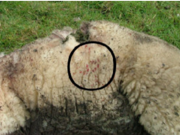
Foto 4: Dood schaap met een gat in de flank, gemaakt door een kraai. Het schaap leefde toen nog, getuige de bloedspatten op de vacht (in de cirkel) (Mulder, 2005).

Een algemeen en steeds vaker waargenomen fenomeen is agressie door kraaien, kauwen en eksters. Hierbij wordt de wol van schapen uitgeplukt (met huidwonden tot gevolg) en in extreme gevallen worden de ogen van lammeren uitgepikt (10) . Een verklaring voor het gedrag van deze vogels is onbekend. Wel is het zo dat de populatie kraaien de afgelopen jaren sterk is toegenomen, maar de vraag blijft open waarom specifiek schapen en lammeren worden gevisieerd.