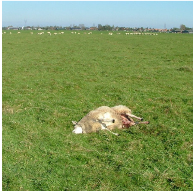
Foto 3: Een verwenteld schaap, eenzaam achtergelaten door de kudde en aangevreten door een vos (Mulder, 2005).

Een volwassen gezond schaap behoort niet tot de normale prooien van een vos. Het is onmogelijk, zelfs voor de grootste vos (van maximaal 9 kilo), om een gezond volwassen schaap of een groot lam van 40 tot 80 kilo te doden, naar de grond te trekken of enigszins in moeilijkheden te brengen. Op de brede, met dichte wol bezette hals en nek hebben zijn kleine smalle bek en hooguit 2 cm lange hoektanden onvoldoende impact. Echter, volwassen schapen die in een slechte conditie verkeren, kunnen wel door vossen worden benaderd. Een op de weide stervend schaap of 'hulpeloze' schapen (ten gevolge van verwentelen of myiasis) blijft eenzaam achter terwijl de kudde verder graast (7) . Vossen kunnen dan hun behoedzaamheid, die ze van nature voor schapen hebben, laten varen en het schaap gaan aanvreten.