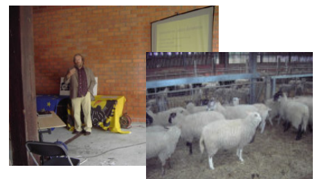
Zoötechnisch Centrum Lovenjoel Begrazing met exoten

“Wie pleit om een schaap, verliest een koe.”