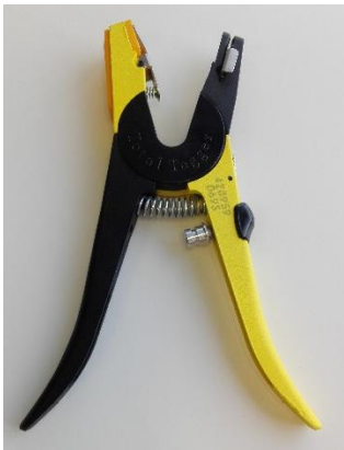
Figuur 1: Tang sluiten met pin