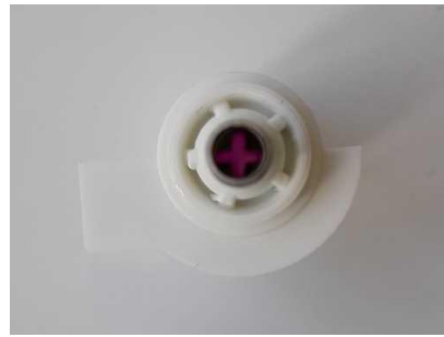
Figuur 2: Staalname is niet gelukt